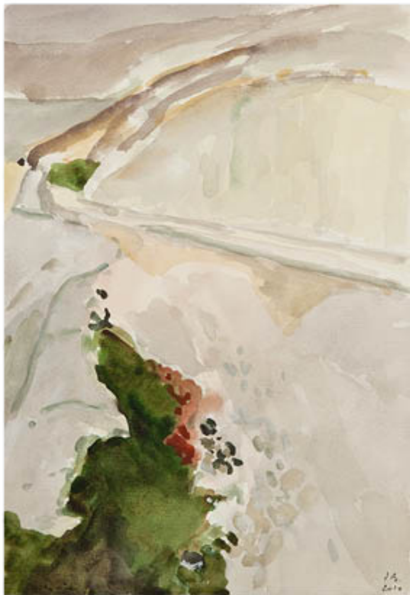
Iles du Frioul aquarelle - 26 x 18 cm - 2010

Cela jusque dans la manière dont il s'approprie l'espace pictural, laquelle n'obéit pas strictement aux lois de la perspective traditionnelle. Il insuffle une liberté, inscrit une exigence dans la découpe et le traitement par la couleur des surfaces à l'intérieur du périmètre défini par le cadre, qui, si elles semblent, cette liberté et cette exigence, toutes deux héritées du cubisme et des diverses expériences du non-figuratif, ne nous invitent pas moins à concentrer au maximum notre attention sur ce qui ne laisse pas de s'accomplir ici devant nos yeux: une parousie du réel à travers l'être peint.