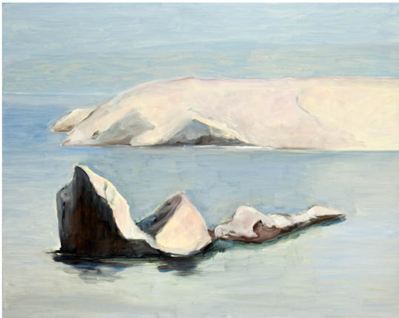
Iles du Frioul huile sur toile - 73 x 92 cm - 2012