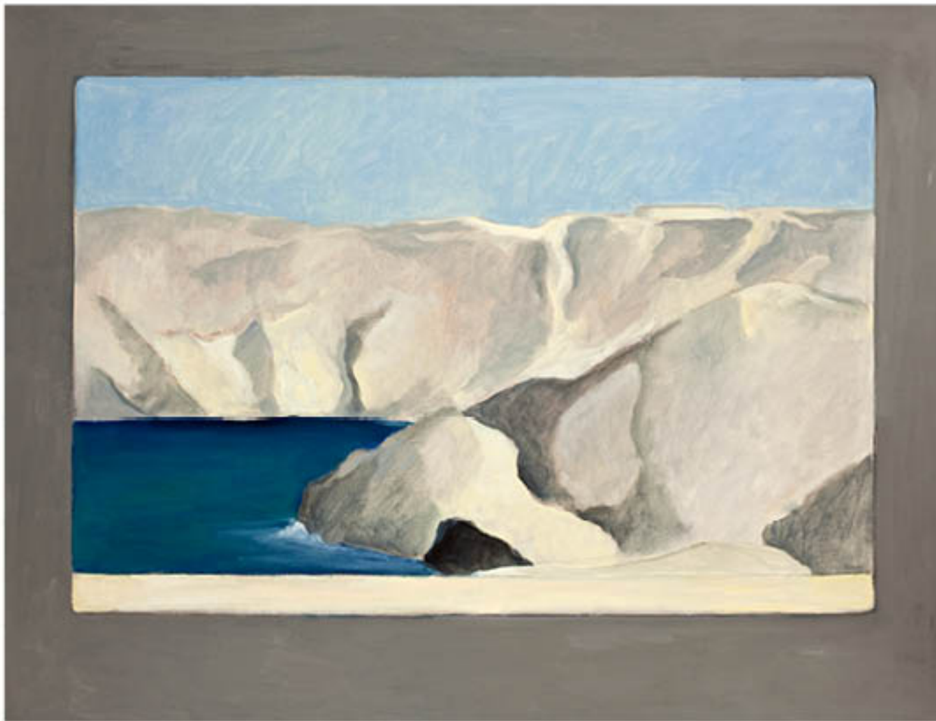
Iles du Frioul huile sur toile - 89 x 116 cm - 2012