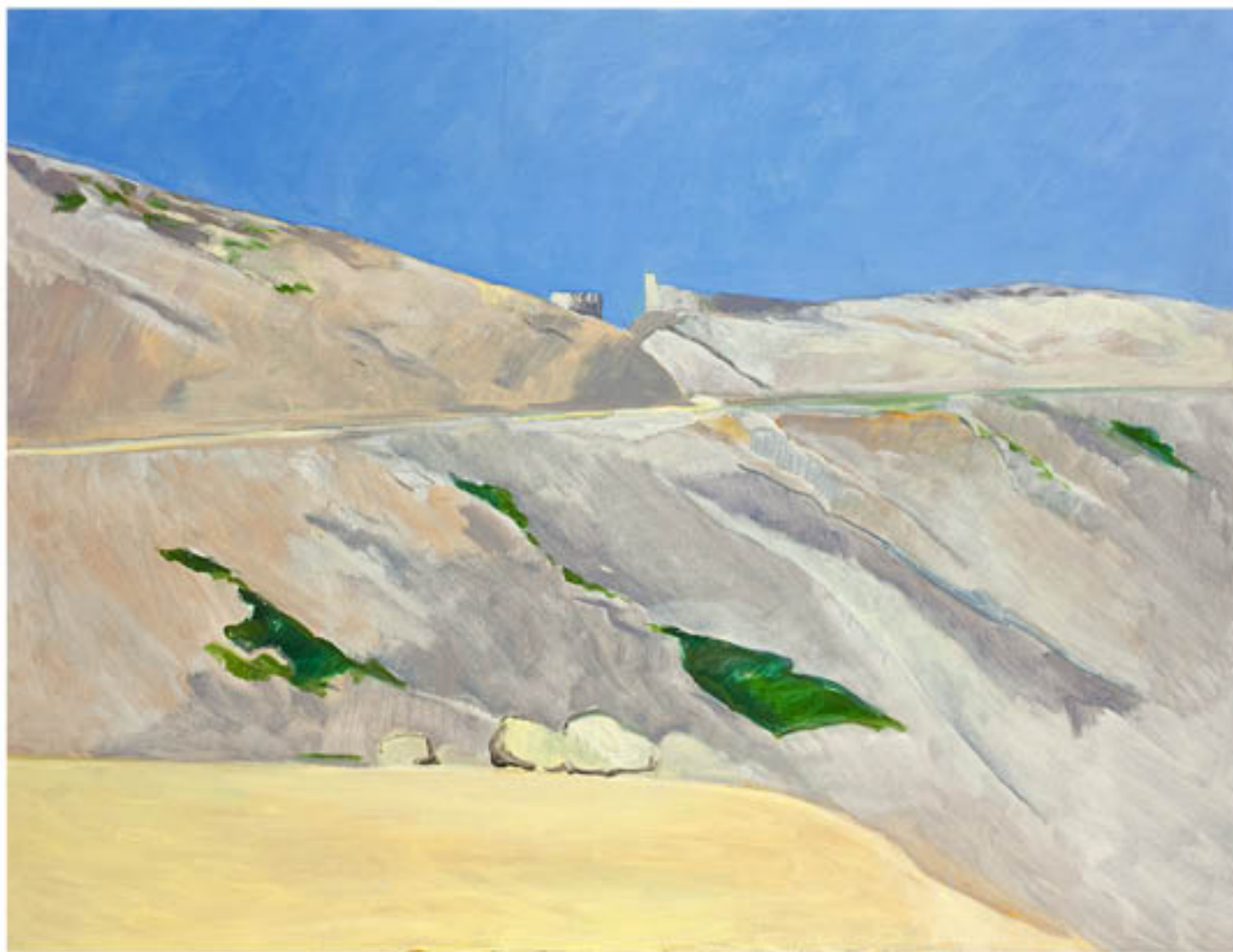
Iles du Frioul huile sur toile - 89 x 116 cm - 2012