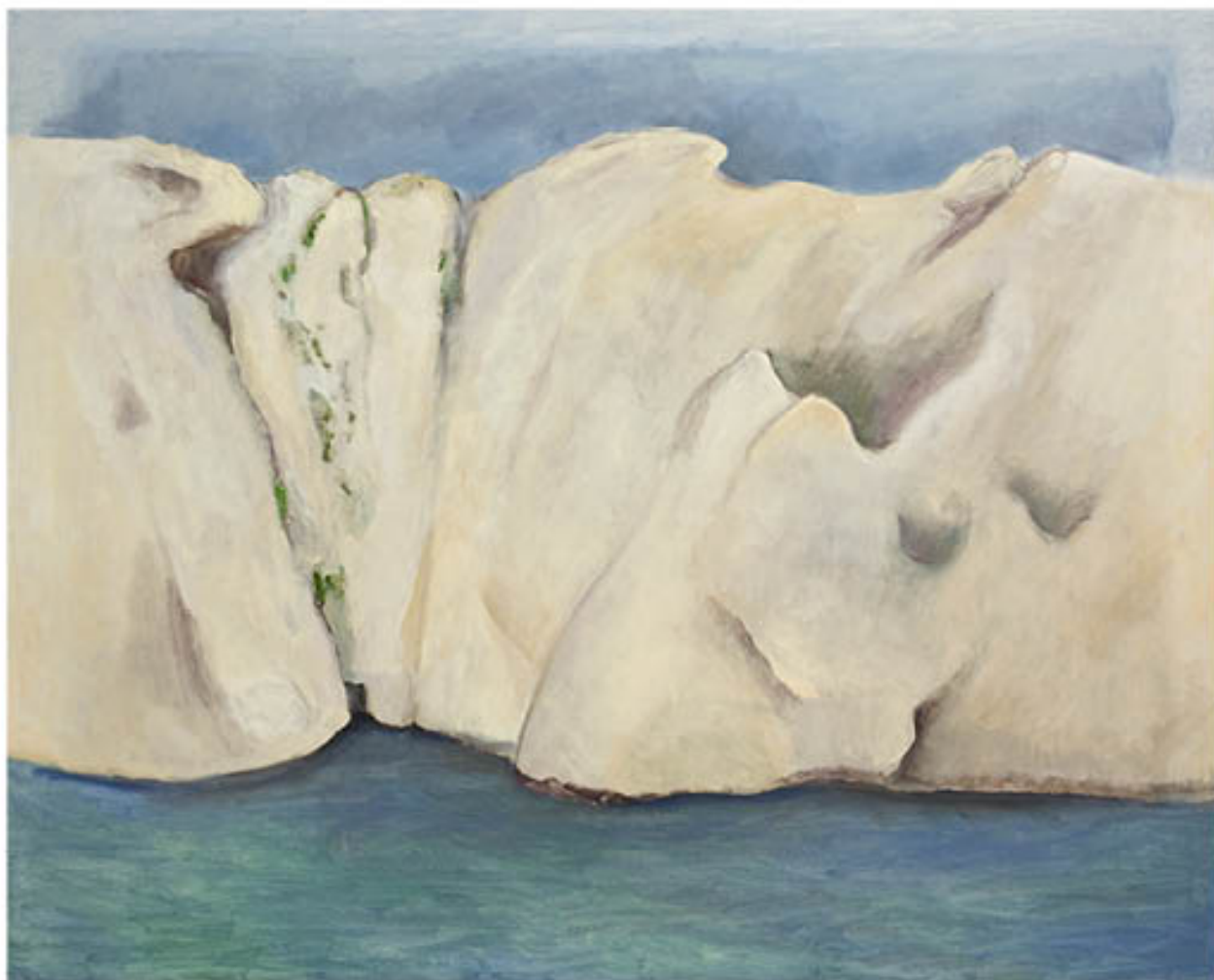
Iles du Frioul huile sur toile - 89x 116 cm - 2012