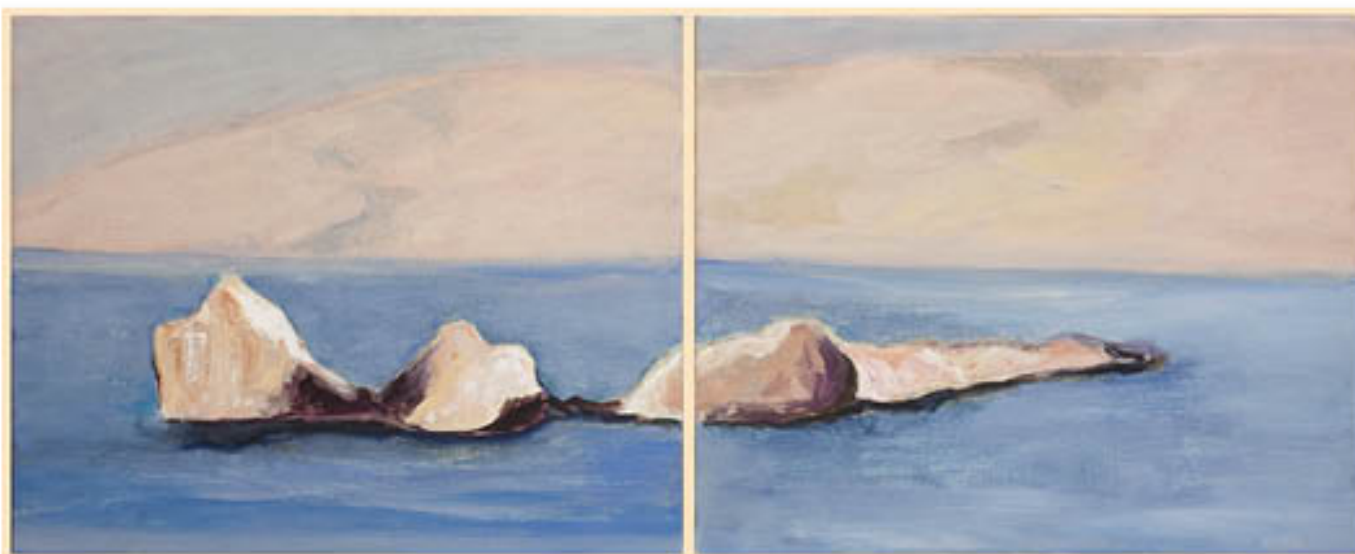
Iles du Fricoul huile sur toile - 33 x 82 cm - 2012