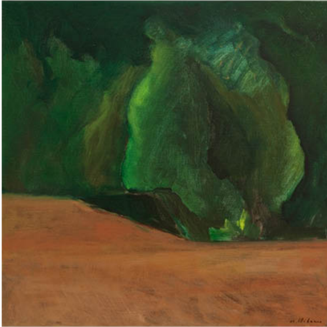
Le tertre huile sur toile - 50 x 50 cm - 2004