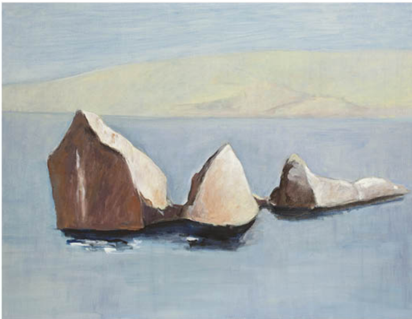
Iles du Frioul huile sur toile - 89 x 116 cm - 2012