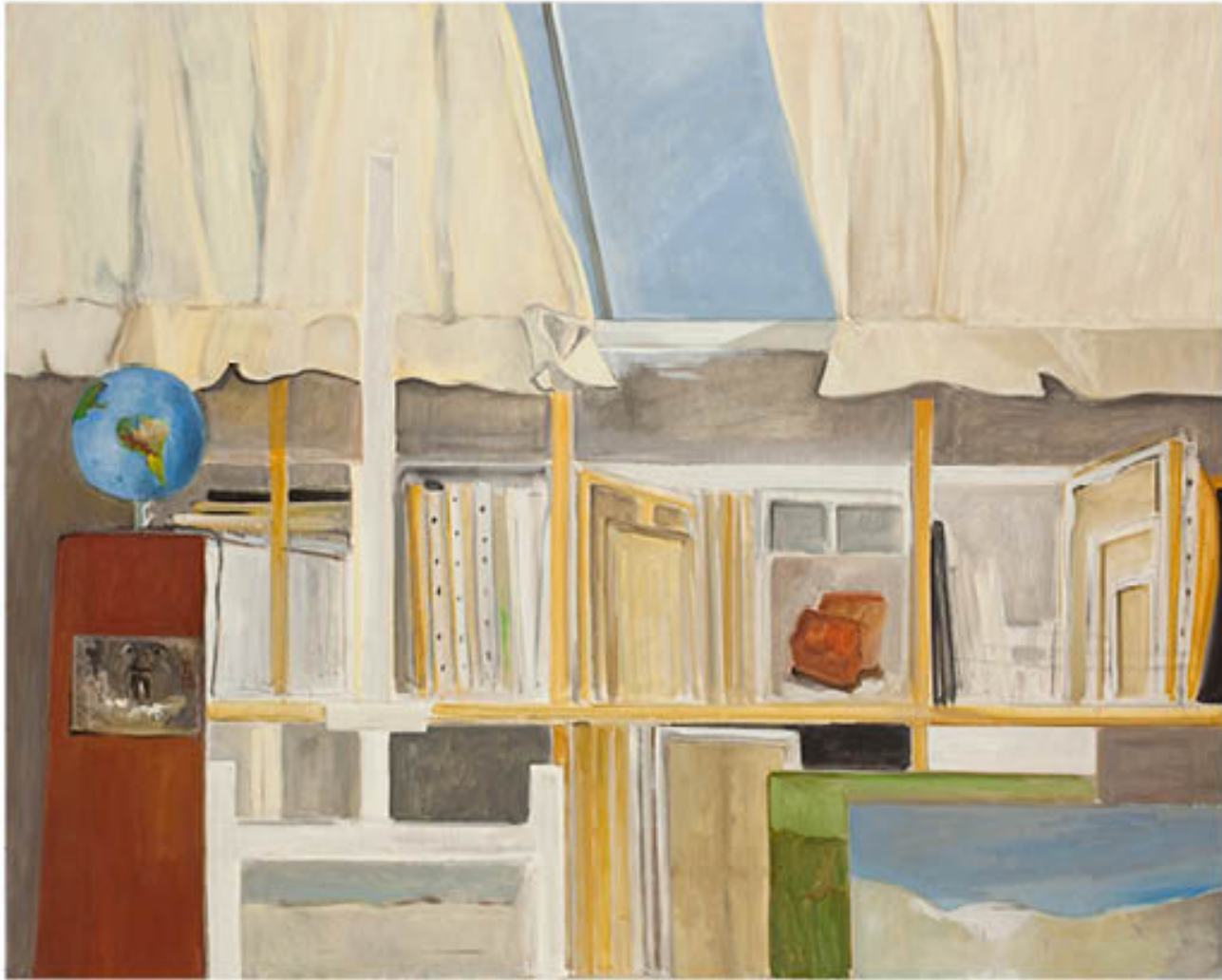
L'atelier huile sur toile - 130 x 162 cm - 2012