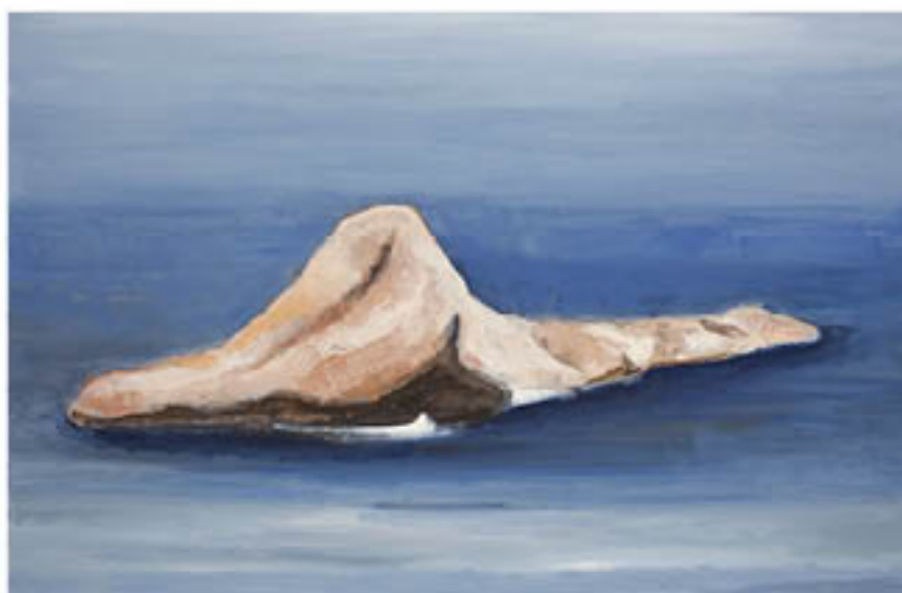
Rocher huile sur toile - 65 x 100 cm - 2012