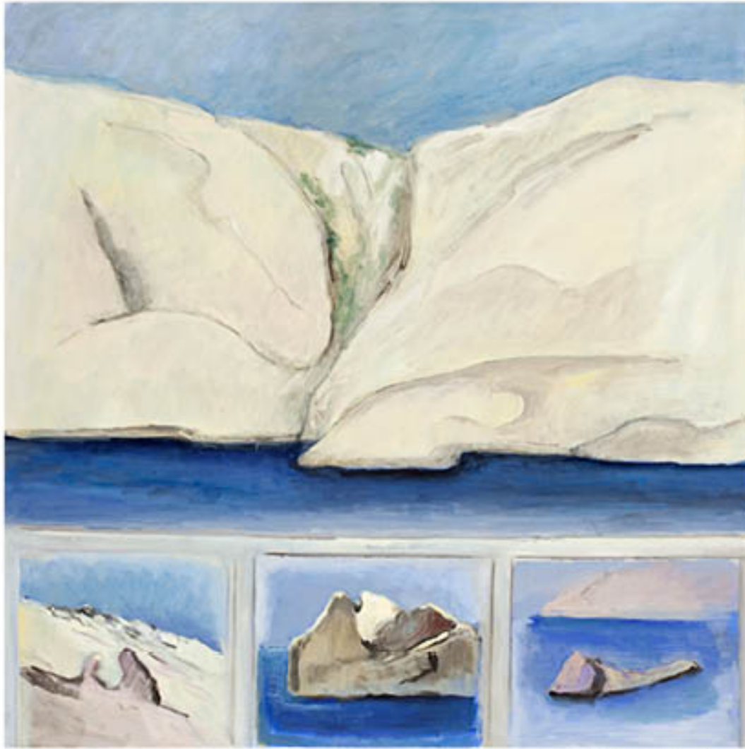
Iles du Frioul huile sur toile - 100 x 100 cm - 2012

Le déclencheur d'émotion artistique peut se révéler être l'humble chose que nul autre que lui ne remarque, un caillou, une racine aussi bien que la lisière d'une forêt, le tracé de sillons dans un champ, que sais-je encore mais qui échappe à tout pittoresque. Je parle évidemment là du matériau brut correspondant au travail préparatoire.