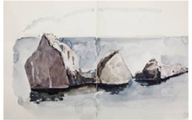
Iles du Frioul - aquarelle - 23 x 30,5 cm - 2011 Iles du Frioul - dessin - 24 x 31 cm - 2011 Iles du Frioul - aquarelle - 31 x 48 cm - 2011