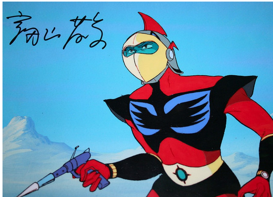
Goldorak - Aktarus