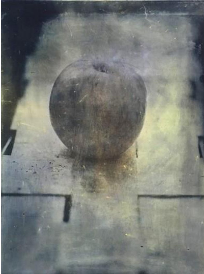
Mela gris, 100 x 80 cm