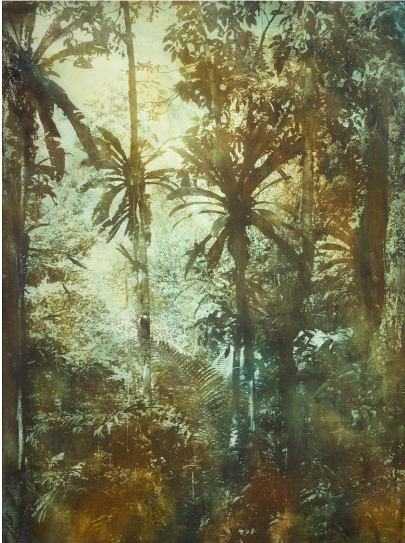
Mania Som, 150 x 120 cm