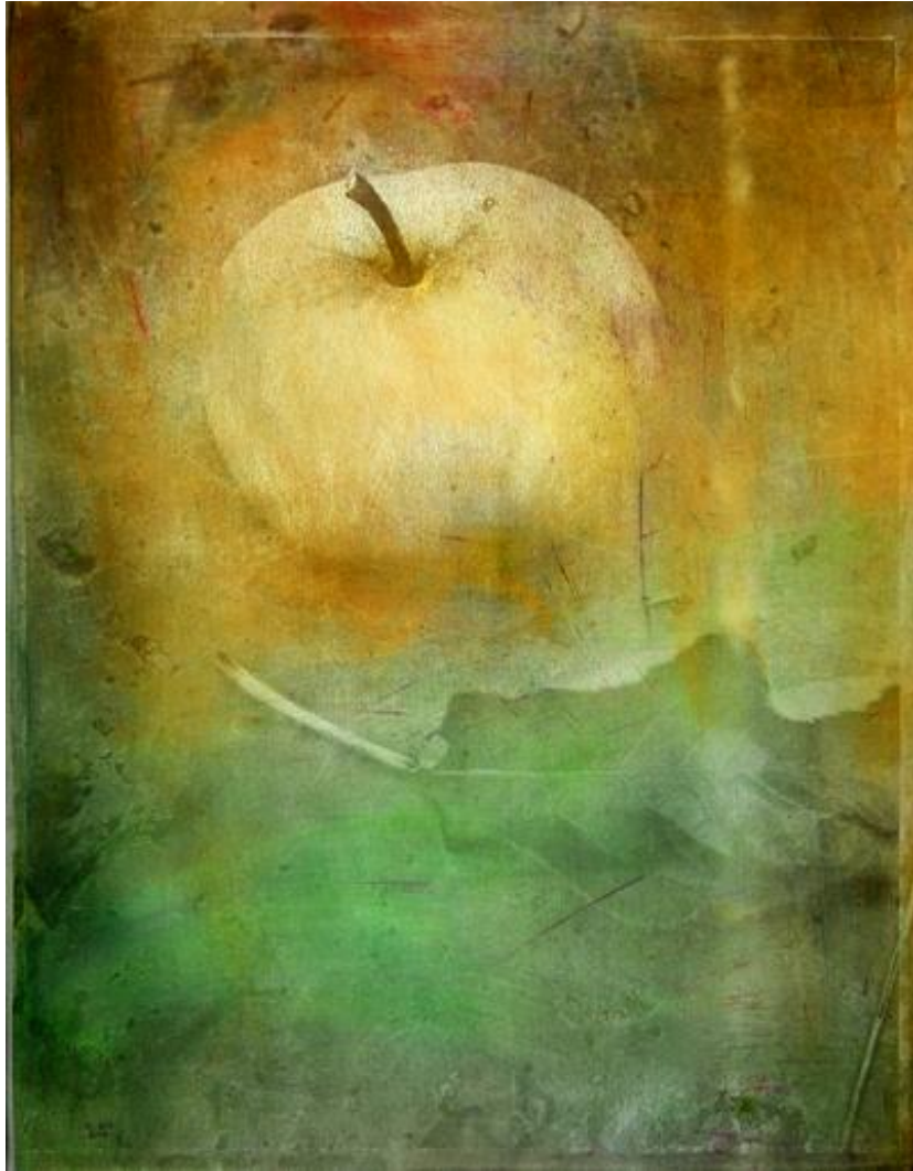
Goldene Frucht, 100 x 81 cm