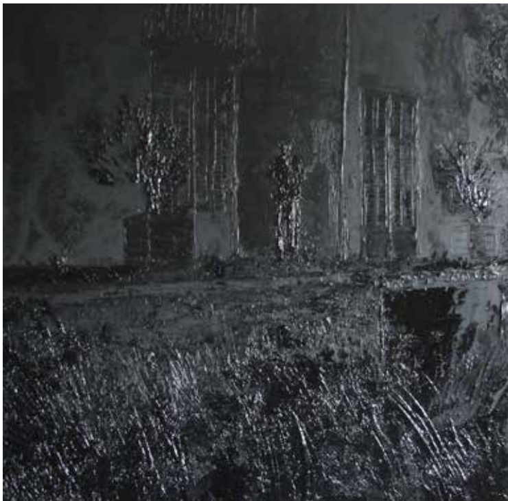
LE VEILLEUR DE PERNAND-VERGELESSES