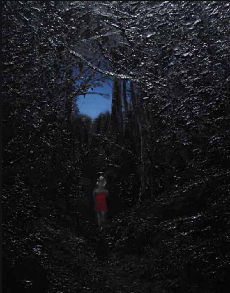
LE PETIT CHAPERON ROUGE